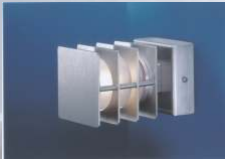
Q.BUS 2 Wand AUSSENLEUCHE IP 55

Edelstahl-Poller, 2mm, mit Lamellen-Blendschutz, Rohrkanten gerundet, Glas satiniert.