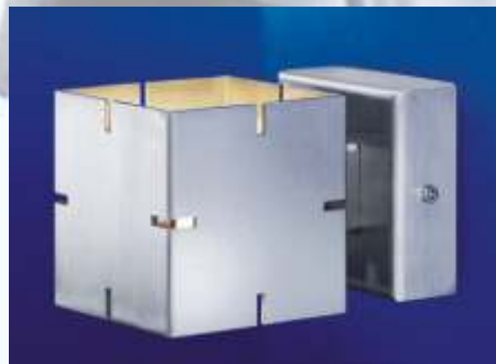
Q.BUS 1 Wand AUSSENLEUCHE IP 55

Wandleuchte aus Edelstahl, 2mm. Das Glas innerhalb des Edelstahl-Korpus erlaubt eine 90°ige Beleuchtung nach unten sowie nach oben (Up und Down) .