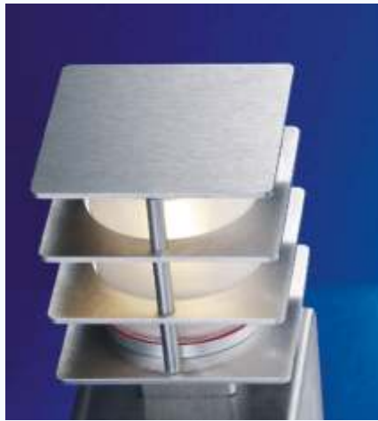
Q.BUS 2 Poller AUSSENLEUCHE IP 54

Edelstahl-Poller, 2mm, mit Lamellen-Blendschutz, Rohrkanten gerundet, Glas satiniert.