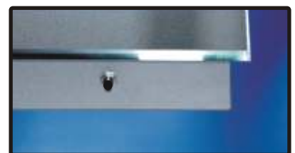
Tastdimmer, unten rechts

Ausser der "normalen" Satinierung kann der Spiegel mit einer hochwertigen " V-Satinierung " versehen werden (s.u.)